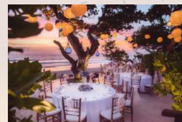
プロデュース／企画