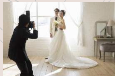
カメラマン（写真／ムービー）