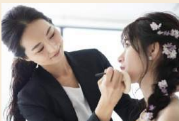
ヘアメイク／着付け