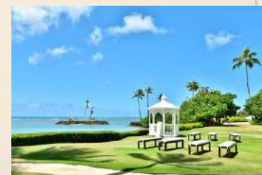
リゾートウェディング