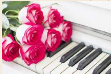
音楽家／ミュージシャン